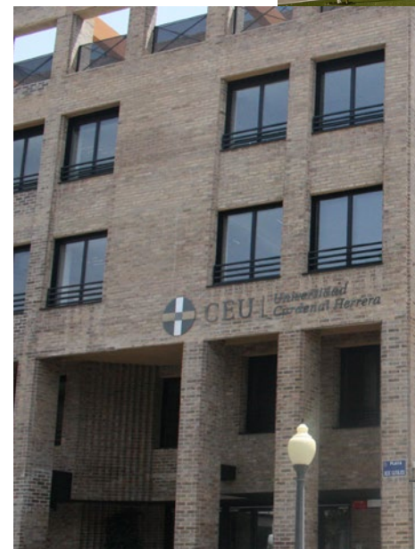
Elche Plaza Reyes Católicos, 19 03204 - Elche