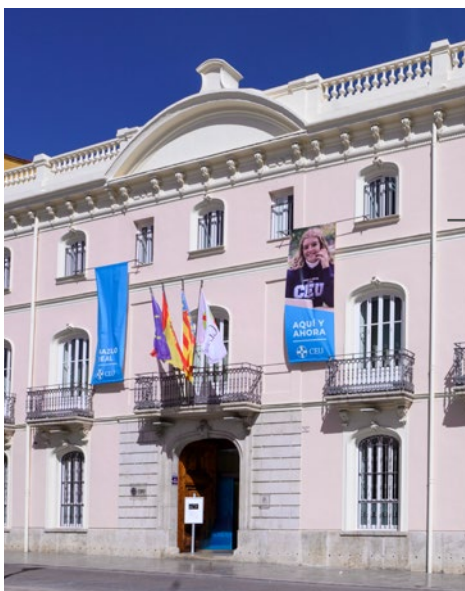
Valencia Palacio de Colomina C/ Almudín, 1 46003 - Valencia