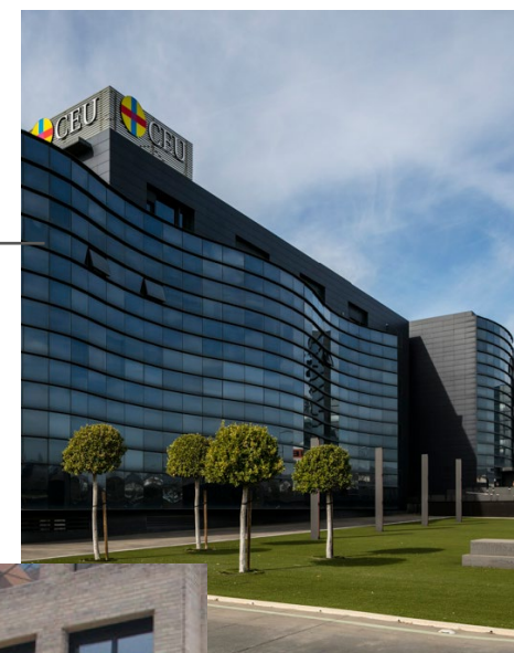
Castellón Grecia, 31 (Ciudad del Transporte II) 12006 - Castellón